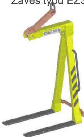
Závěs typu EZS